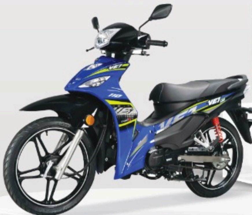
HADIAH UTAMA VE1-110E

*PENENTUAN YANG LAYAK ADALAH BERDASARKAN NO. AKAUN ATAU NO. PLAT KENDERAAN YANG TERLIBAT DAN BUKAN MENGIKUT BILANGAN TRANSAKSI