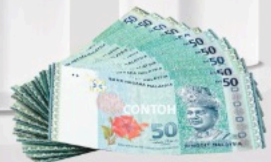
HADIAH KE-5 HINGGA KE-14 WANG TUNAI RM500 SETIAP SATU