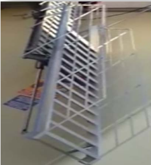
Contoh : Tangga Mekanikal