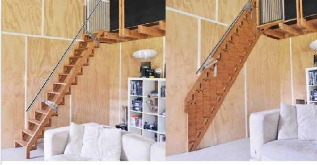
Contoh : Tangga Lipat (Folding Stairs)