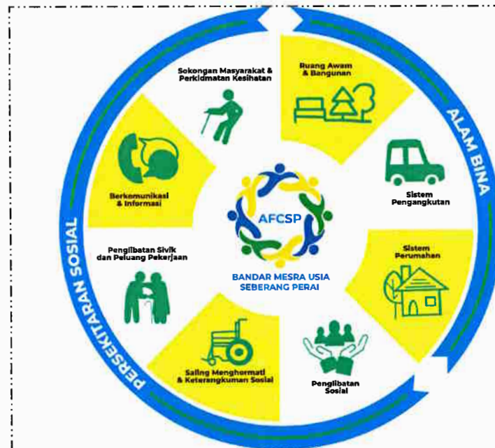
Gambar rajah 1 : 8 domain dalam AFC