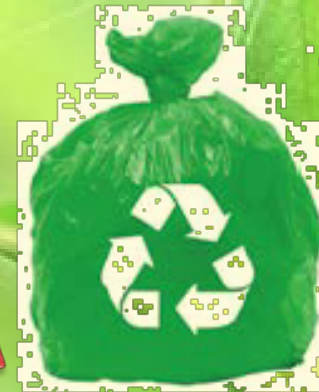
Sisa Kitar Semula