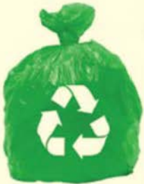
Sisa Kitar Semula