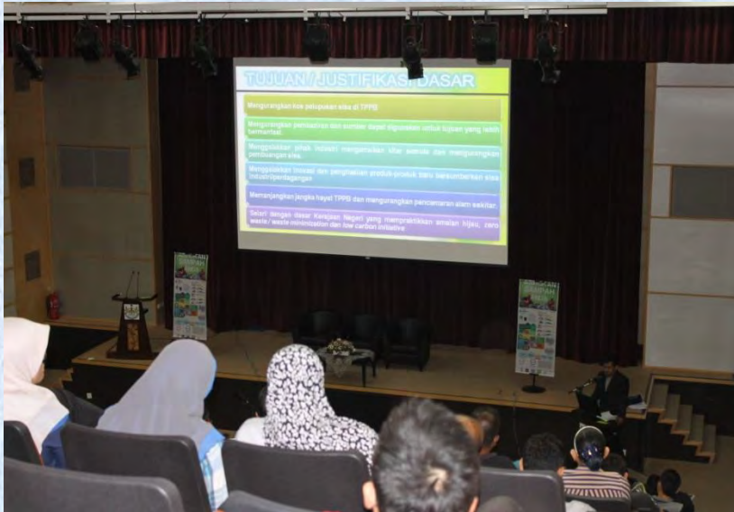
Taklimat di Auditorium MPSP kepada JMB pada 27 Februari 2016