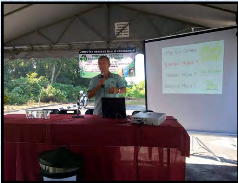
Taklimat di Taman Pekatra Indah pada 21 Februari 2016