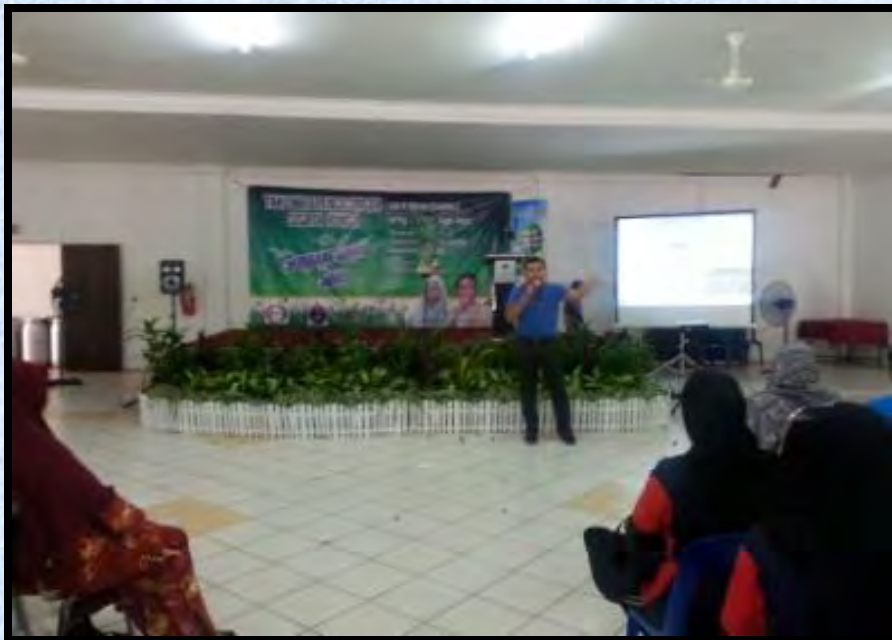
Taklimat di Dewan Taman Permata 29 September 2016