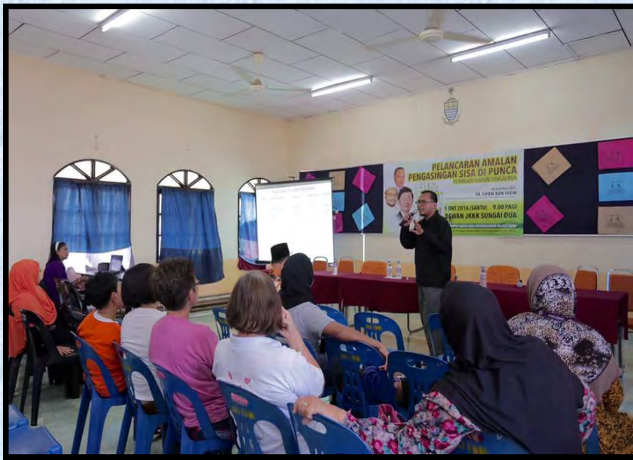
Taklimat di Dewan JKKK Sg. Dua pada 1 Oktober 2016