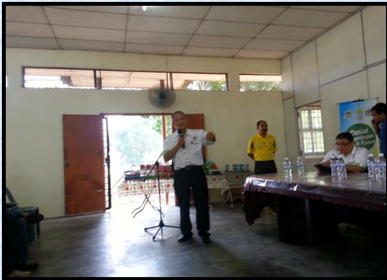
Penerangan Kepentingan Pengasingan Sisa Di Punca Penduduk di Taman Tasek Mutiara Taman Tunku pada 10 April 2016