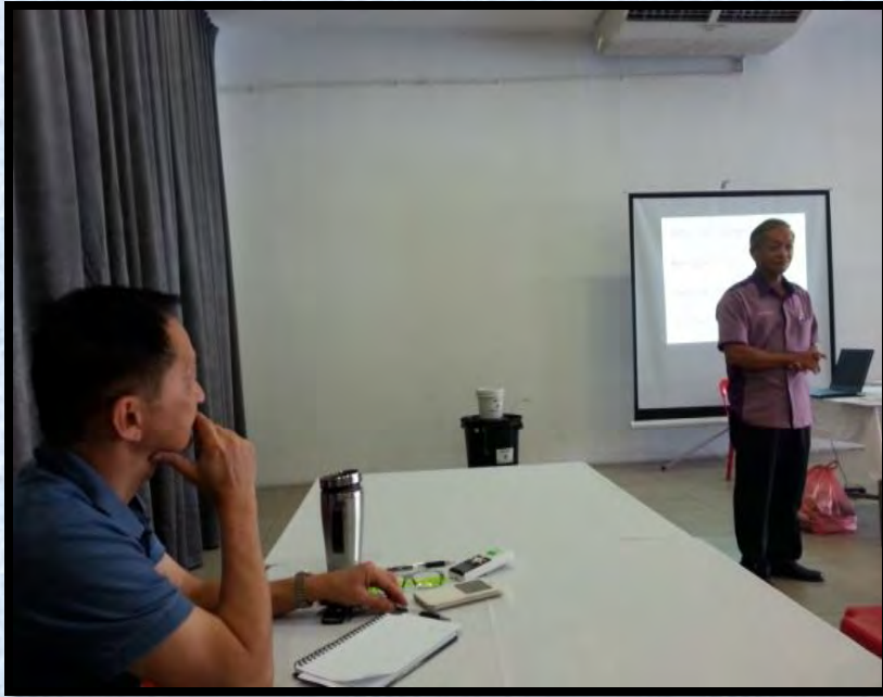
Taklimat Kitar Semula Taman Villa Oren pada 10 Januari 2016